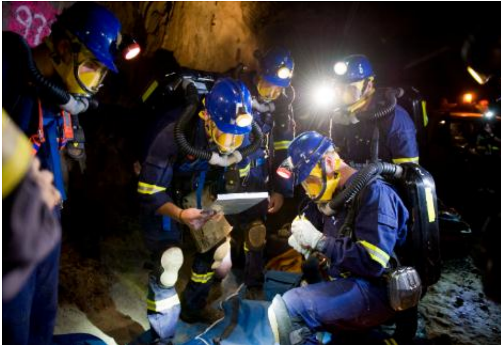
Наши дни: идет горноспасательная операция с использованием дыхательных аппаратов Dräger PSS BG4 plus, Австралия