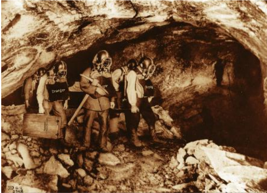
Горноспасательная бригада в аппаратах Draeger в шахте, 1912 год