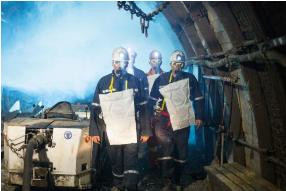
Аварийная эвакуация из шахты с изолирующими самоспасателями Dräger Oxy 6000