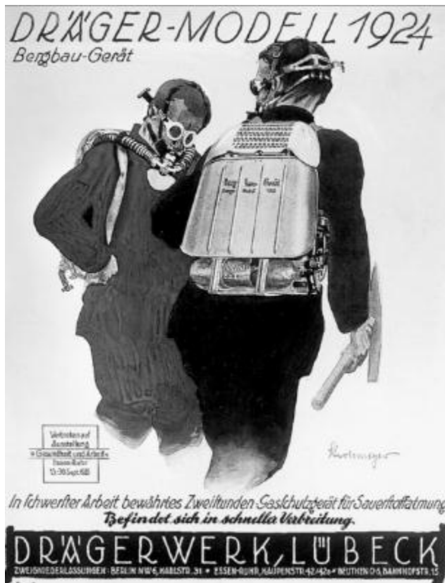
Реклама «Модели 1924» - первого оснащенного маской дыхательного аппарата Dräger, 1924 год